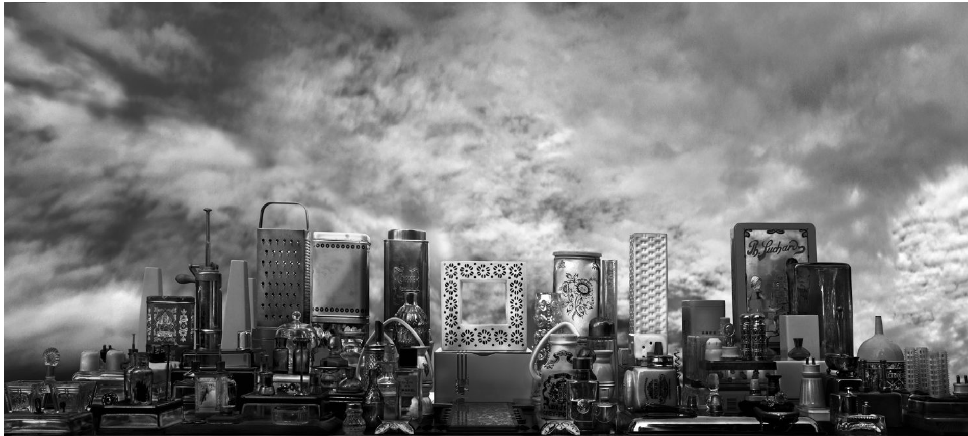
"Force majeure, Paris", 2023, på Galleri Flach.

Föga förvånande dyker många vackra unga män upp i Fribergs urval. Det binder samman hennes fotografiska praktik med Ernst Thiels samlande. Precis som Friberg var den "motviliga affärsmannen" Thiel trött på den stereotypa manlighet han blev tvungen att iklä sig för att klättra i den svenska affärsvärlden och köpte gärna verk som porträtterade androgynt motsträviga karaktärer, som personifierar en ovilja att underordna sig normen.