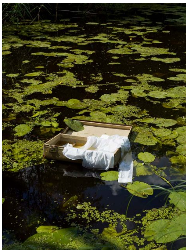
"Handed 2", 2022.