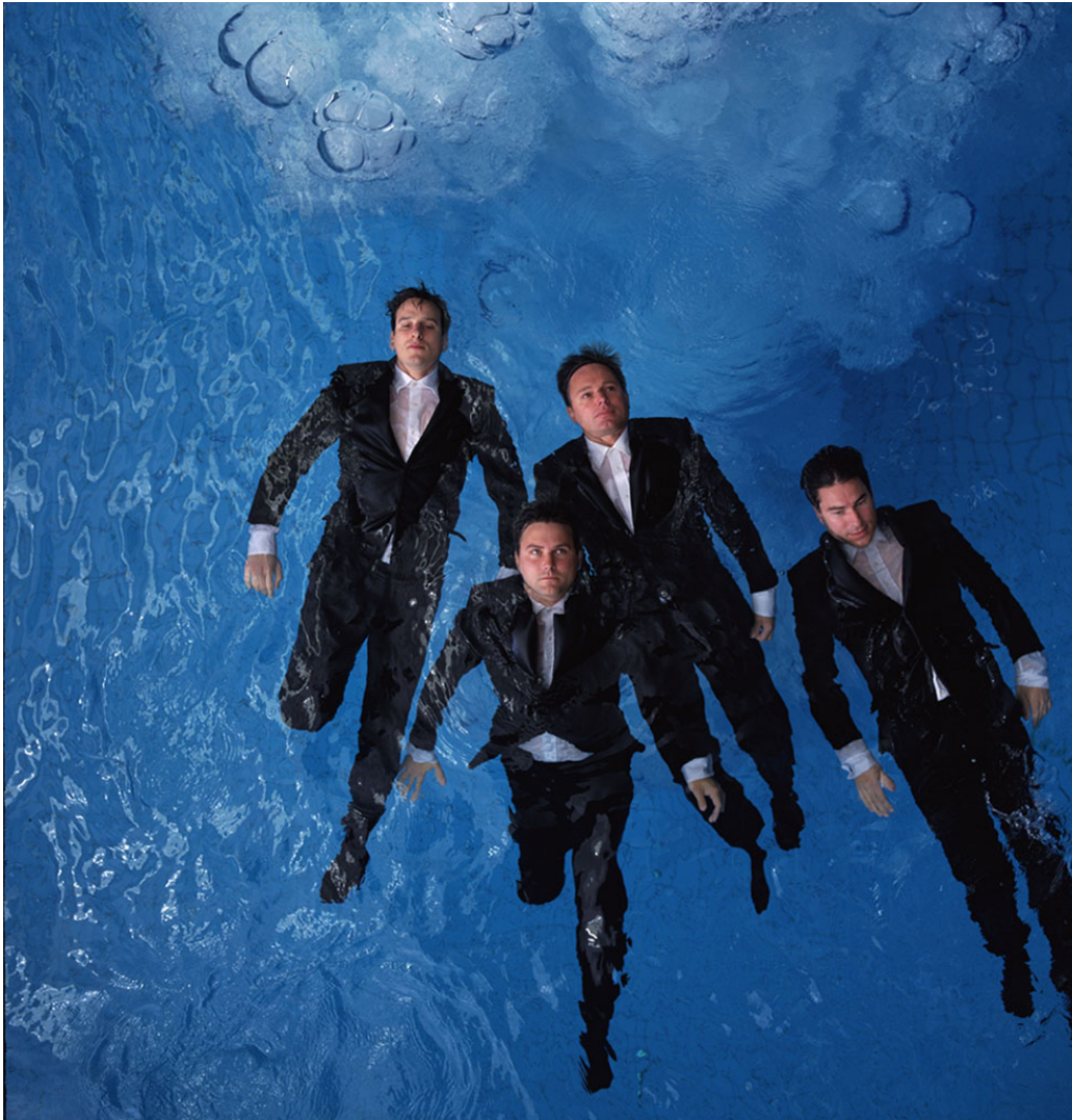
Maria Friberg, Almost There 1 , 2000.